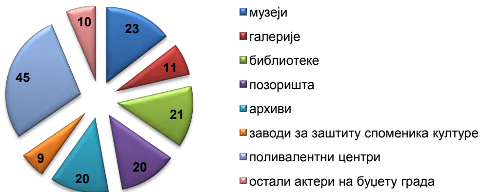
Приказ 1: Број интервјуа по типу установе

Када је реч о цивилном сектору у области културе, обављено је 283 интервјуа (групних и индивидуалних) са представницима различитих удружења грађана у култури, неформалним групама и појединцима. Треба нагласити да је истраживачки тим Завода настојао да идентификује све актере, али да су разговори вођени са неколико представника поменуте сцене. Такође у табели на страни код представљања структуре цивилног сектора наведени су сви актери које смо препознали као оне који се примарно баве културом. Међутим, у обзир треба узети чињеницу да је цивилни сектор често неухватљив због потенцијалне краткотрајности и/или недовољне транспарентности, те постоји могућност да је неки од актера пренебрегнут приликом набрајања.